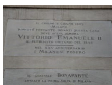
Targa Palazzo Serbelloni