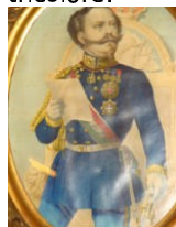
Vittorio Emanuele II

A seguire, gli interventi di Gallo, Grassi e Nobolo, tutti concentrati su controverse interpretazioni di personaggi e vicende risorgimentali. Il dibattito susseguente, di alto profilo culturale, come prevedibile essendo coinvolti quattro docenti universitari, veniva concluso, a serata inoltrata, dal tocco della campana della presidente e dall'offerta alla relatrice di un mazzo di fiori tricolore.