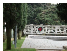
Memoriale della Croce Rossa a Solferino