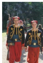
Battaglia di Magenta