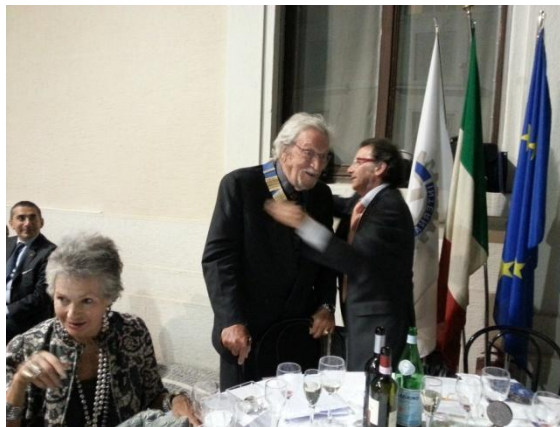
Il Passaggio delle consegne