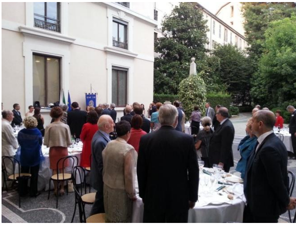
Il saluto alle bandiere