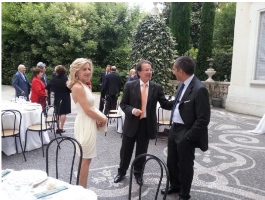
Il Presidente Polverino riceve gli ospiti